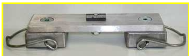
SUPPORTO CALAMITATO DOPPIO