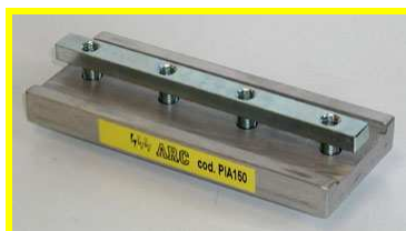
PIASTRA DI GIUNZIONE GUIDE