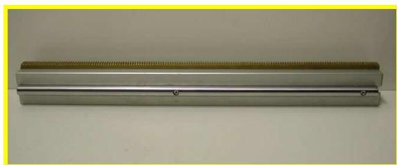
GUIDA DI SCORRIMENTO 45X45