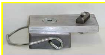
SUPPORTO CALAMITATO SEMPLICE