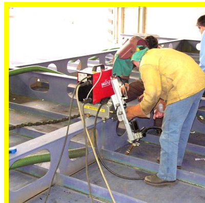
4) SALTO OSTACOLO BULBO PER SALDATURA SUCCESSIVA