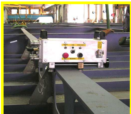
1) INSTALLAZIONE CARRO SU' BANDA