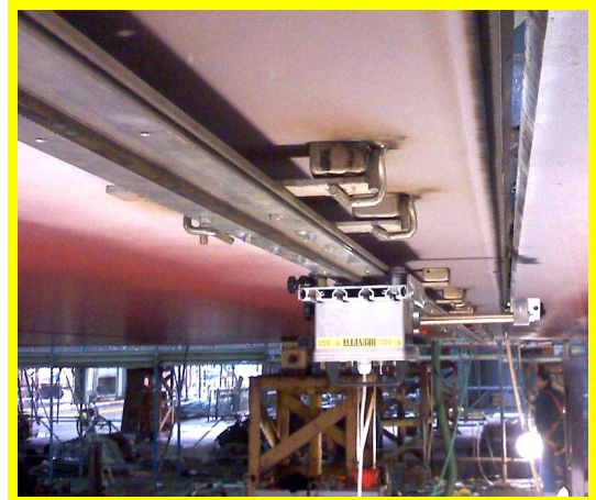
CARRO IN OPERA APPLICATO SOTTOTESTA SU NAVE

Le caratteristiche tecniche sono soggette a continui miglioramenti, pertanto la ditta costruttrice si riserva il diritto di effettuare modifiche senza alcun preavviso. Technical features are being continuously improved, therefore the manufacturer reserves the right to make modifications without prior notice.