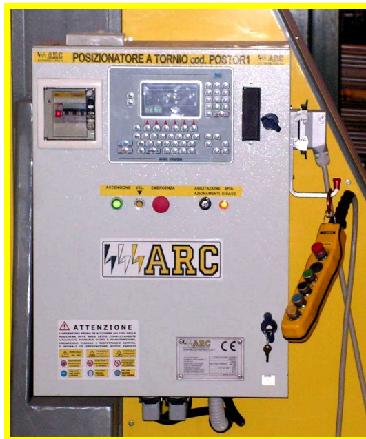
QUADRO COMANDI CON CONTROLLO CN MINI VISION SU' POSTAZIONE FISSA

Le caratteristiche tecniche sono soggette a continui miglioramenti, pertanto la ditta costruttrice si riserva il diritto di effettuare modifiche senza alcun preavviso. Technical features are being continuously improved, therefore the manufacturer reserves the right to make modifications without prior notice.