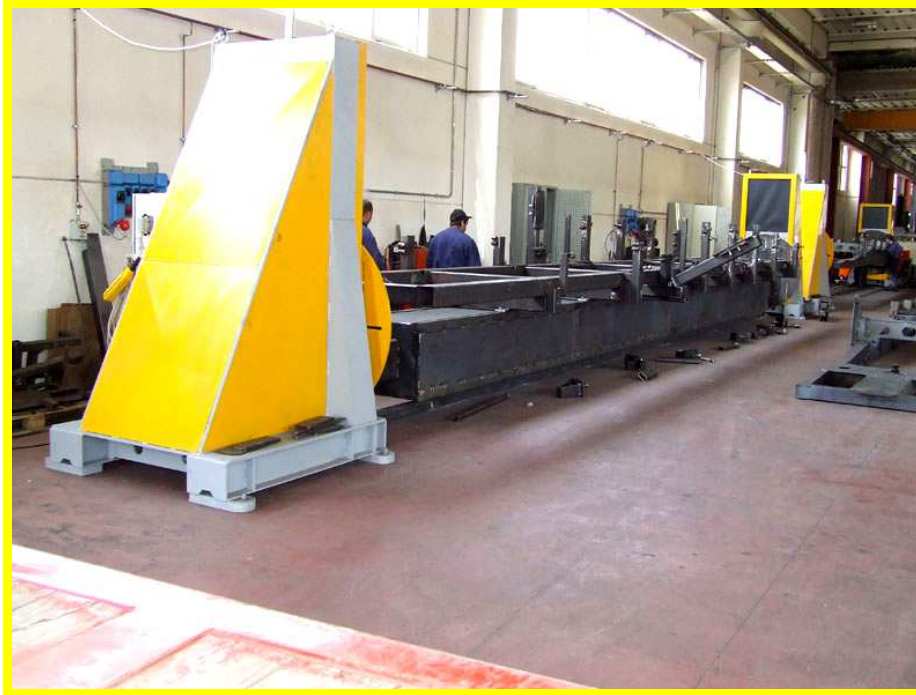
POSIZIONATORE A TORNIO CON TRAVE DI COLLEGAMENTO PORTAMASCHERE